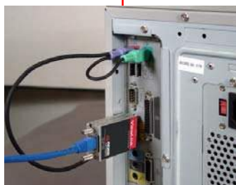
トランスミッタを直接 PC ビデオ、キーボード、マウスに接続する。